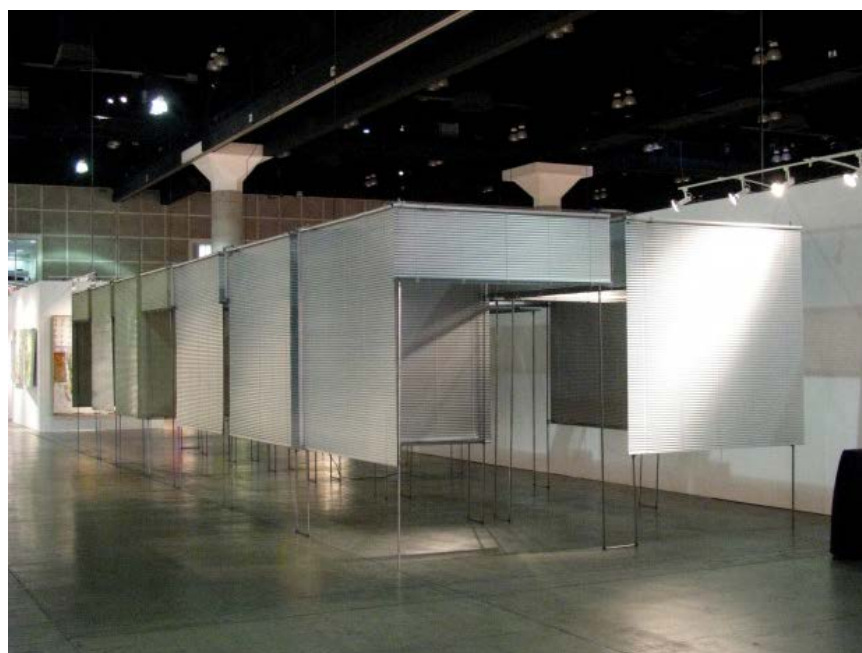
Subjectivity Value (extended), 2012

📅 August 4, 2014 👤 Daniel 📄 Cover Story 💬 0 Comments