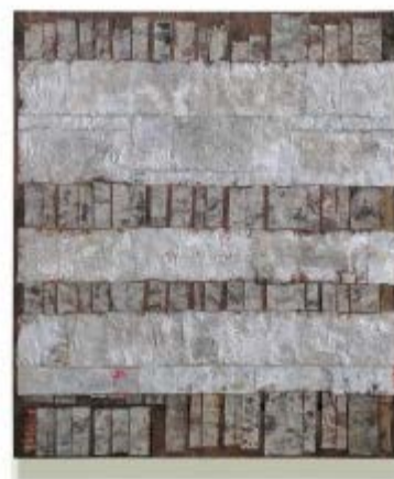
In Between, 2012

최근 완성된 프로젝트는 '01-05 Subjectivity Value'입니다. 블라인드, 철강, 전기 모터 등으로 만든 설치 미술입니다. 금속 블라인드속 '방'을 걸으면서, 공간과 빛이 변환하는 것을 볼 수 있는 공간입니다. 이 설치 미술은 우리의 일상생활의 사물들을 새로운 방식으로 볼 수 있습니다.