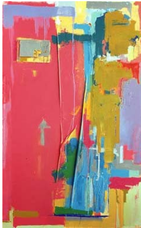
Fold in Pink, 2001

고난은 진정한 행복함의 통로입니다. 저는 어려움, 행복함 용어를 잘 쓰지 않습니다. 하지만 확실한건 자기발전은 더 나은 아티스트를 만듭니다. 그래서 저는 제 능력의 한계에 항상 도전하고 자기계발을 합니다. 자기 계발 속에서 자신과의 싸움 속에서 저는 행복함을 느낍니다. 그리고 자기 개선은 제가 마지막 숨을 쉴 때까지 느낄 수 있는 행복이라고 생각합니다.